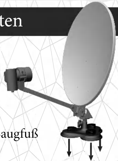
2. Mit Saugfuß