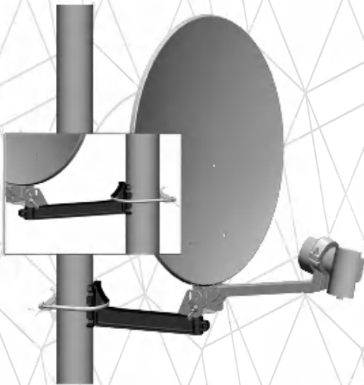
3. Mast Befestigung